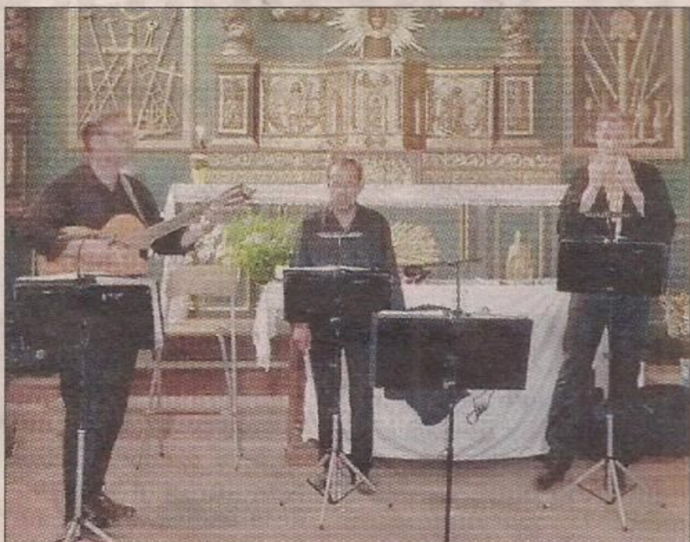
VOYAGE MUSICAL. Polyphonies et instruments traditionnels.

Voguant sur les chants polyphoniques corses et les instruments traditionnels comme la guitare, la mandoline, le charango, le cetera, mais aussi le violon et les percussions, les chanteurs et musiciens d'Avà Corsica, qui signifie « Ici et maintenant », ont proposé une croisière musicale en Méditerranée.